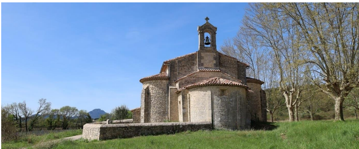
Notre-Dame d'Aleyrac à Sauteyrargues