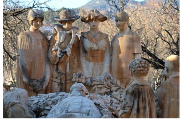
Monument aux morts de Paul Dardé