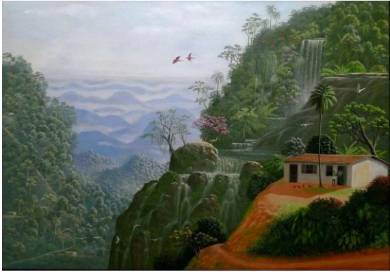
Musée de Lodève