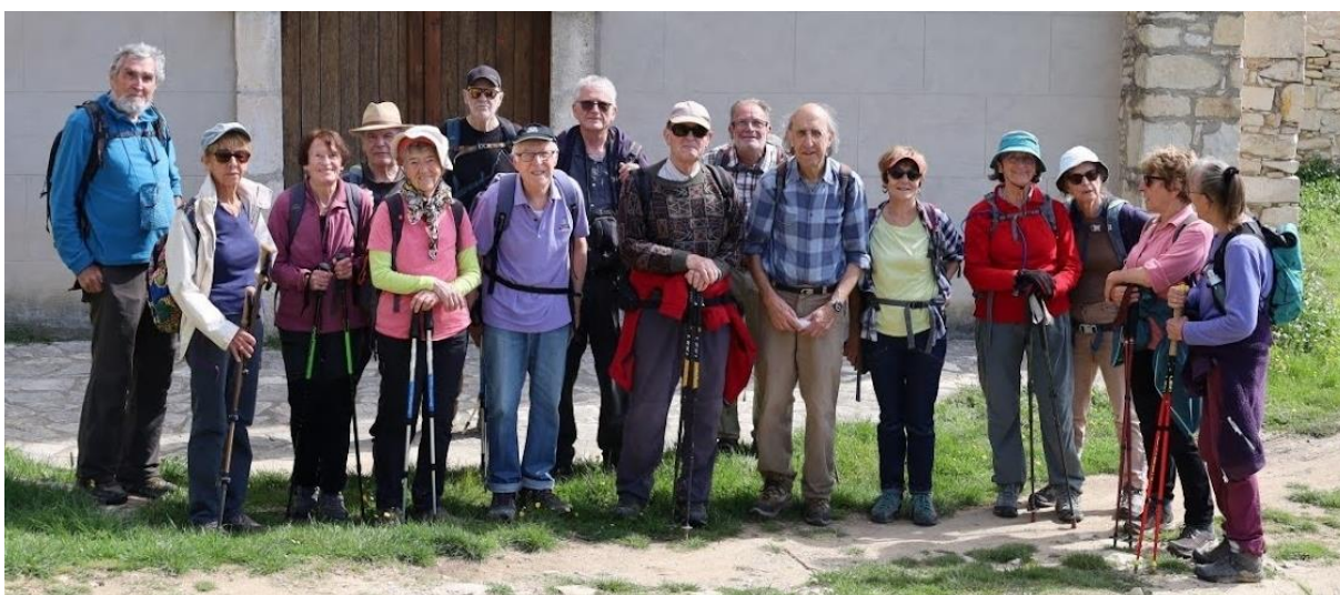
Un échantillon de randonneurs !