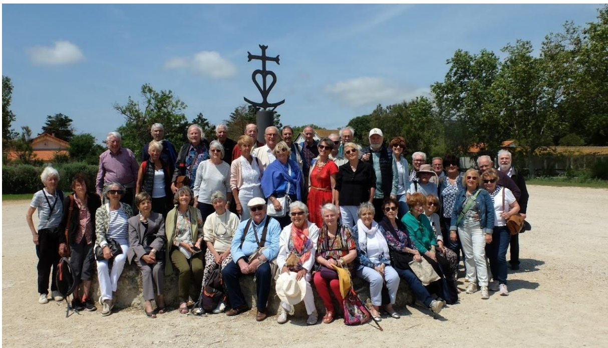
Fête d'été au domaine de Méjanes